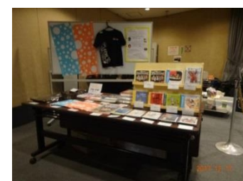
オペラシアターこんにやく座の CD・DVD・本などがいっぱい並びました。