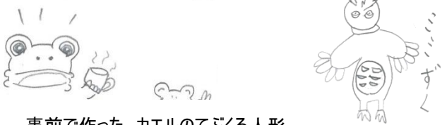
事前で作った、カエルのてぶくろ人形