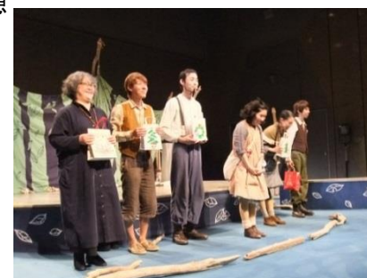
ステキな舞台をありがとうございました。