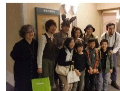
終演後、写真を撮りました。