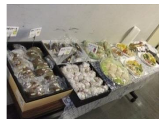
小夜食は、ぎんなんご飯・ピクルス・生春巻き・鳥ハム・ケーキ